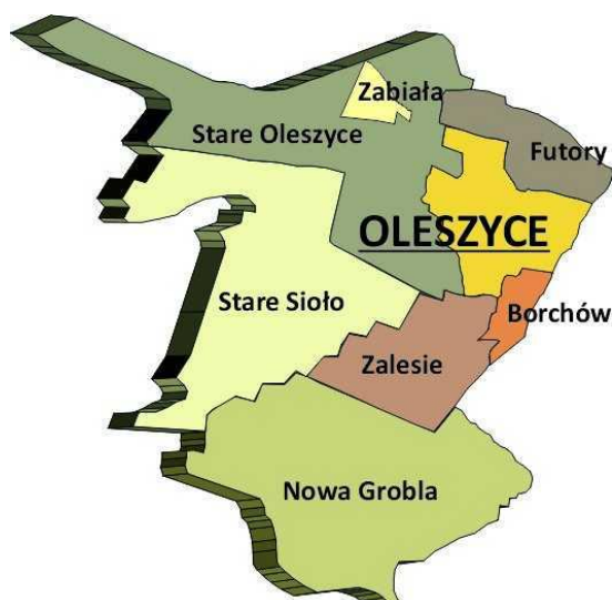
Rysunek 2 Podział administracyjny Miasta i Gminy Oleszyce

W skład gminy miejsko-wiejskiej Oleszyce wchodzi miasto Oleszyce i 7 sołectw (Borchów, Futory, Nowa Grobla, Stare Oleszyce, Stare Sióło, Zalesie, Zabiąta).