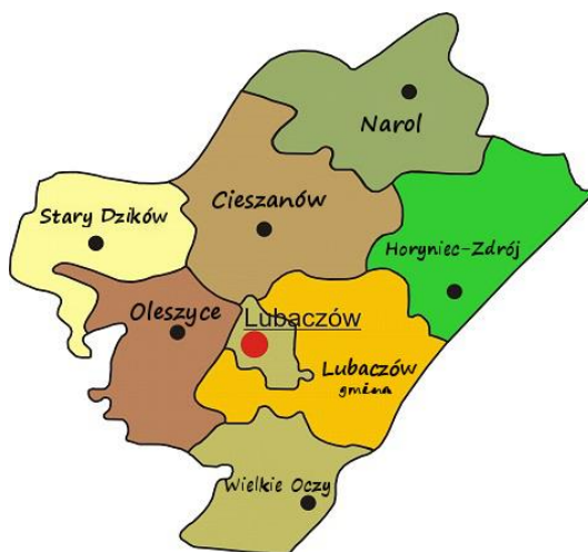
Rysunek 1 Położenie Miasta i Gminy Oleszyce na tle powiatu Lubaczowskiego

Łączny obszar jaki zajmuje gmina Oleszyce wynosi 151,87 km 2 , w tym miasto Oleszyce zajmują 5,0 km 2 . Rozciąga się na przestrzeni 16 km na linii północ-południe i około 10 km na linii wschód-zachód.